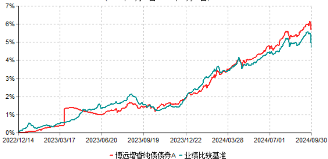
博远增睿纯债债券A累计净值增长率与业绩比较基准收益率历史走势对比图 (2022年12月14日-2024年09月30日)