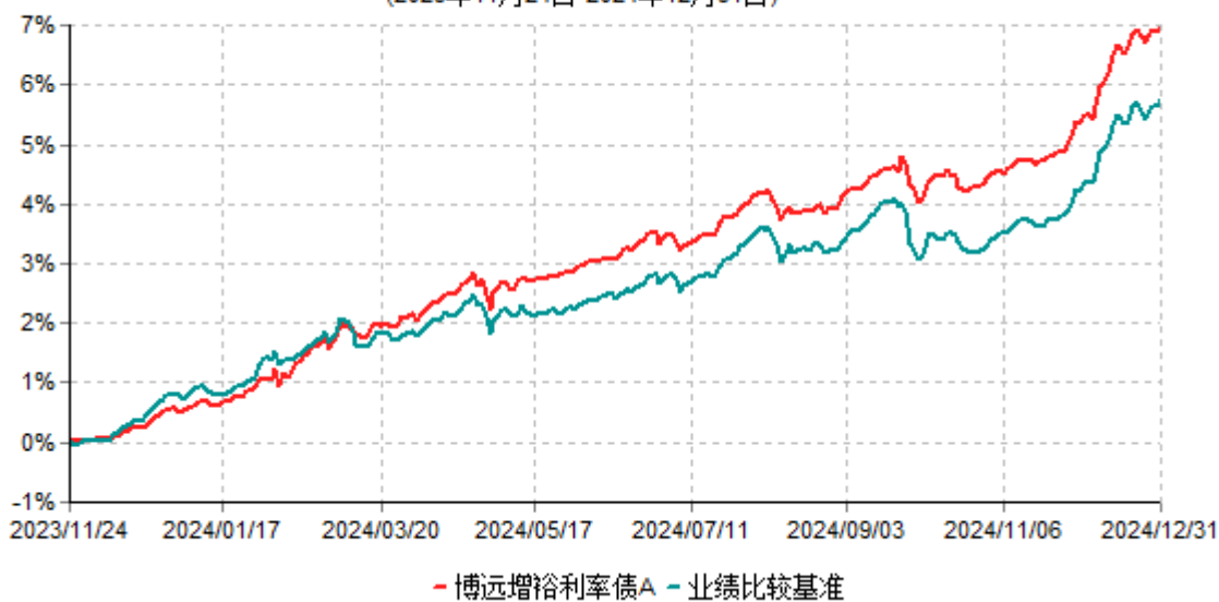
博远增裕利率债A累计净值增长率与业绩比较基准收益率历史走势对比图 (2023年11月24日-2024年12月31日)