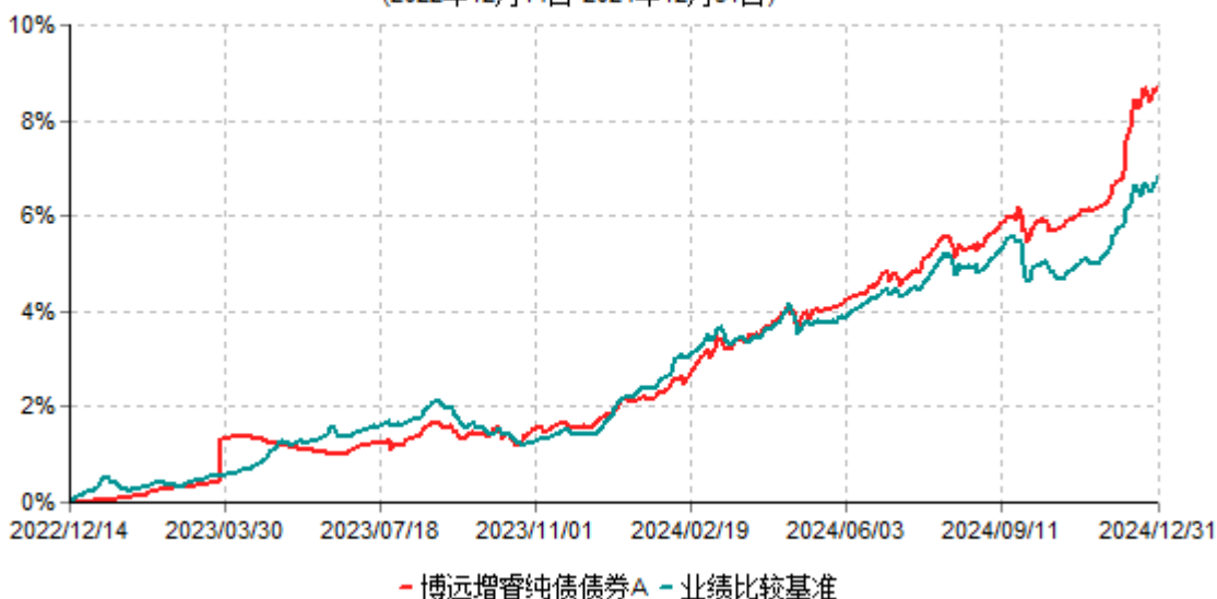
博远增睿纯债债券A累计净值增长率与业绩比较基准收益率历史走势对比图 (2022年12月14日-2024年12月31日)